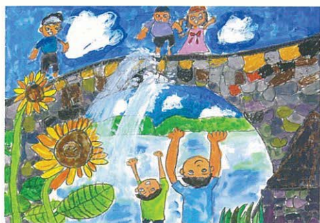
〔小学校(低学年の部) 金賞作品〕