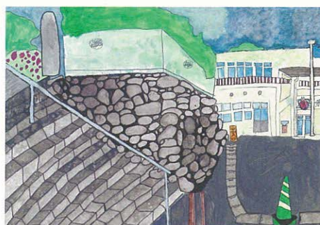
〔小学校(高学年の部) 金賞作品〕