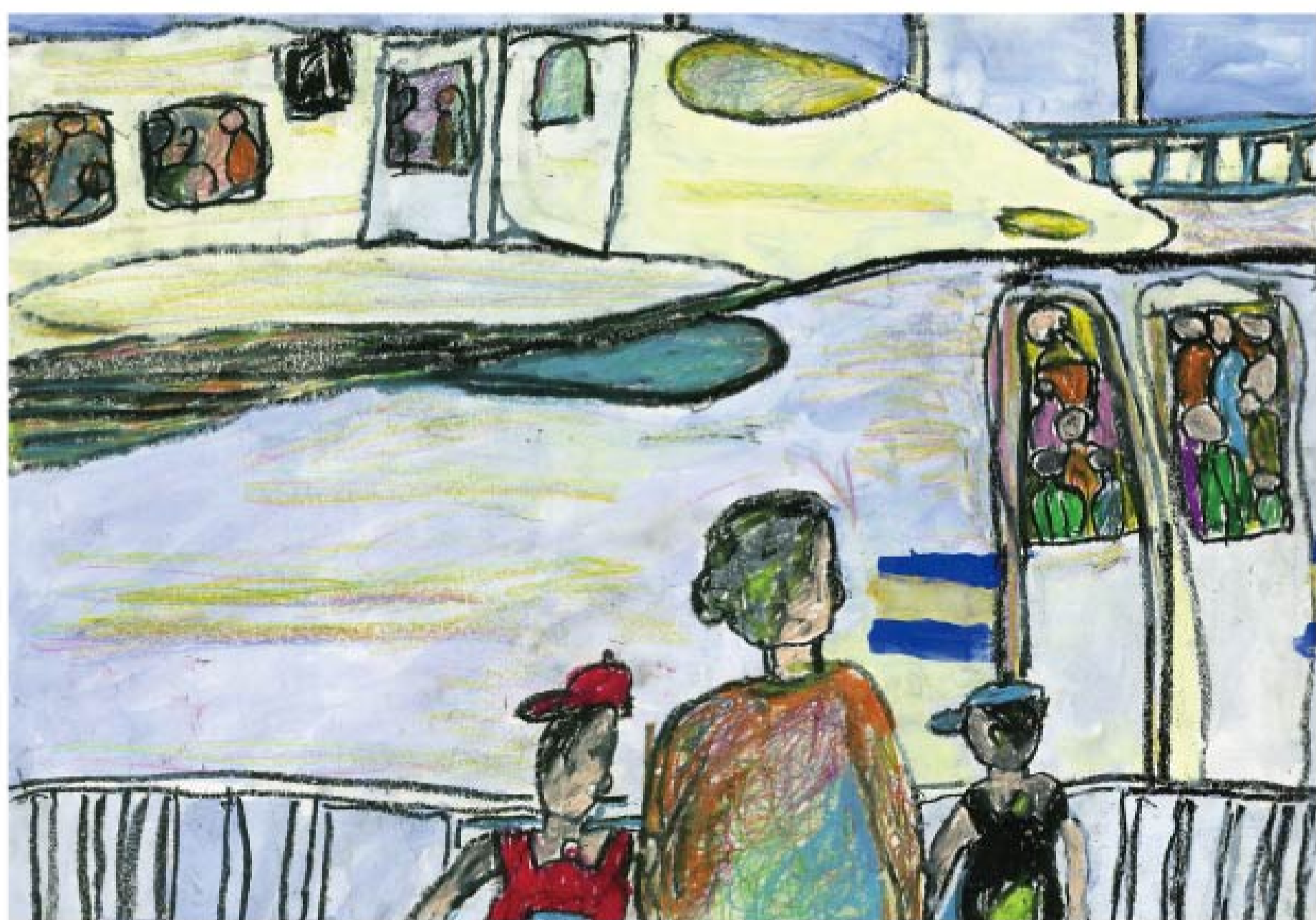
〔小学校(低学年の部) 金賞作品〕

「 さ さ さ を支える み 身近な み 土木 ど 施設 ど 」 ～川、ダム、鉄道、道路、港、トンネル、橋、上下水道などの土木施設や作業風景～