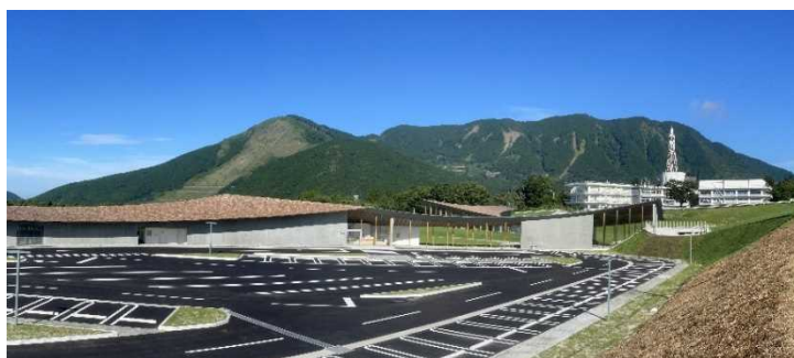
熊本地震 震災ミュージアムK I O K U